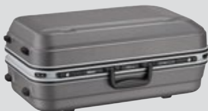
Geantă pentru obiectiv CT-608 (inclusă)