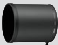
Parasolar obiectiv HK-40 (inclus)