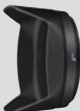
Parasolar baionetă HB-75 (accesoriu inclus)