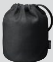
Husă pentru obiectiv CL-1218 (accesoriu opțional)